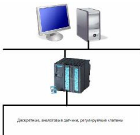
Рис.3. Структурная схема АСУТП мазутного хозяйства Костромской ГРЭС

Структурная схема системы представлена на рис.3.